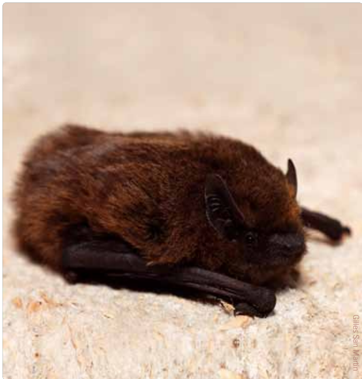
Gilles San Martin