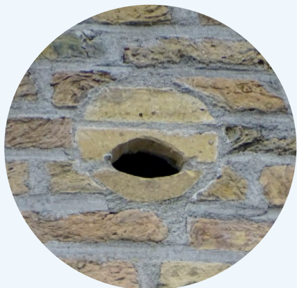
Aménagement discret d'un trou de boulin au moulin de Standdaarbuiten (Pays-Bas)