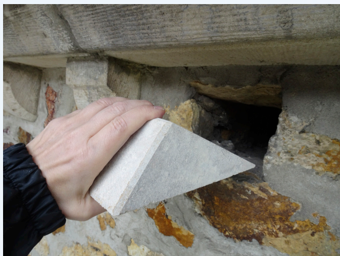
Aménagement de trou de boulin « à l'italienne »