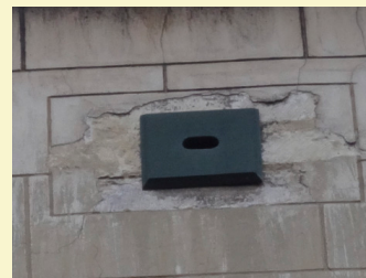
Aménagement en bois de Mark Pearse.