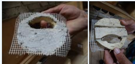
Côtés dos et face du moulage